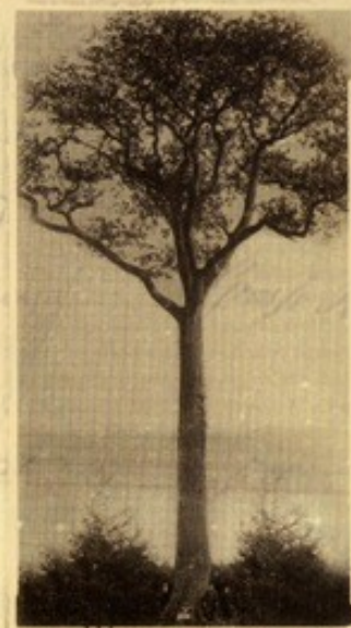
Die „Königsleiche“ auf einer Aufnahme von 1900

Seit dem 01. Juli 1971 ist der Landkreis Leer der vorerster letzte Gutsbesitzer.