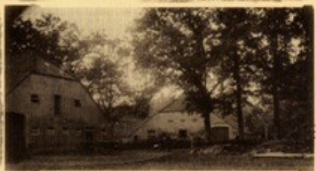
Hinterhaus und Scheune von Gut Stikelkamp um 1900